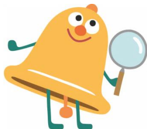
シラベルくん

「郷土の魅力発見」調べる学習コンクールに応募してみませんか？ 図書館では調べる学習コンクールに関連して、調べる学習体験講座 と子どものための郷土講座を開催します。 参加したい郷土講座を開催する各図書館・ライフパーク倉敷へお申し 込みください。